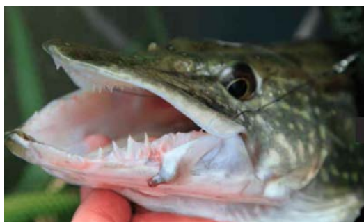
Detta är en gädda.